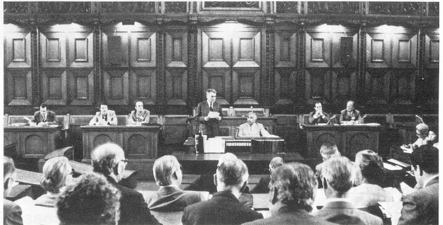
Lors de la séance de la Commission des Suisses de l'étranger.

Ouverture officielle du Congrès – Wildt'sches Haus – cadre magnifique – ambiance très sympathi-