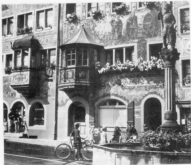
La grand-rue sans trafic de Stein am Rhein (ONST).