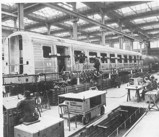
Construction d'un wagon CFF à Neuhausen (SIG).

la région du Randen a une résonance toute particulière dans leur cœur; peut-être parce qu'ils y découvrent une étendue qui rejoint les aspirations des pionniers et des trappeurs! Dans ce jeu plein de mystère où ombre et lumière, soleil et brouillard se mêlent, ils puisent des forces revivifiantes, et les sentiers aux mille lacets, même s'ils les ont déjà parcourus des centaines de fois, continuent de leur apporter un enchantement et un parfum d'aventure toujours renouvelés. D'autres régions n'en imposent pas moins leur charme, le Reiat, par exemple, qui ouvre sa haute plaine au sud du Randen. Avec son sol pierreux, il a conservé en maints endroits un aspect de «Terre inconnue». Malgré tout, dans les principales colonies paysannes de jadis, on trouve la marque du monde contemporain avec ces petites communautés de gens qui retournent à la terre pour se «ressourcer» loin du bruit des villes. Cette attitude ne doit pas être interprétée comme une fuite, mais bien comme une façon de prendre du recul, car, en s'installant dans ces contrées, on endosse en même temps un certain nombre d'inconvénients: le régime sévère des hivers, la bise coupante, les sautes d'humeur de la température.