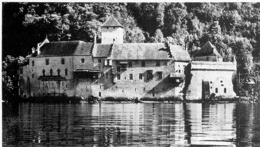
Le château de Chillon - Lac Léman.

tingen van de hotelsector, hebben de andere vormen van logies (huurchalets en -appartementen, campings, caravaning, jeugdherbergen, enz.) ondertussen een grote ontwikkeling gekend; in 1974 werd het aantal overnachtingen in deze gelegenheden op zowat 32,5 miljoen geschat, een cijfer dat van de overnachtingen in de klassieke hotelkamers benadert; dat laatste bedraagt nl. 34,7 miljoen, waarvan 19,8 miljoen voor buitenlandse hotels (bij het begin van de eeuw kregen zij nog 3/4 van de overnachtingen). Opnieuw zijn het de Duitsers die het grootste contingent daarvan geleverd hebben, gevolgd door de Fransen, de Nederlanders en de Belgen; het totaal aantal overnachtingen van deze groep (2,85 miljoen) was als volgt verdeeld: 1,55 miljoen voor de hotelbranche en 1,3 miljoen voor de andere logiesgelegenheden.