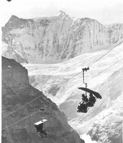
Les joies du ski. Het genot van het skisport.