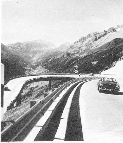
La route du Gothard De Gotthard route. Le glacier de Grindelwald. De Grindelwald gletsjer