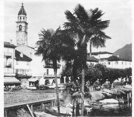
La végétation tropicale du Tessin: le port d'Ascona. Ticino en zijn tropische gevassen: de haven van Ascona. (Onst)