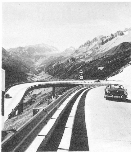
La route du Gothard De Gotthard route. Le glacier de Grindelwald. De Grindelwald gletsjer