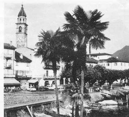
La végétation tropicale du Tessin: le port d'Ascona.