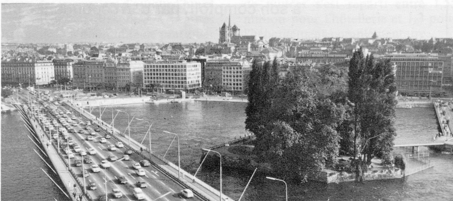
Genève, siège de nombreuses organisations internationales Genova, zetel van talrijke internationale organisaties

Autrefois, le poste actif le plus important de la balance des revenus était le tourisme ; mais il a été supplanté par celui des revenus des investissements à l'étranger, ce qui illustre bien l'accession de la Suisse au rang de grande place financière internationale ainsi que l'ampleur qu'a prise «cet empire secret» par lequel on désigne les filiales étrangères des sociétés suisses. Outre les banques et le tourisme, donc, les assurances, les sociétés de commerce ou de conseil - sans omettre à nouveau les industries qui, par les redevances qu'elles touchent pour des licences ou brevets cédés à l'étranger y contribuent également - sont autant de branches dont l'apport à l'économie du pays est déterminant.