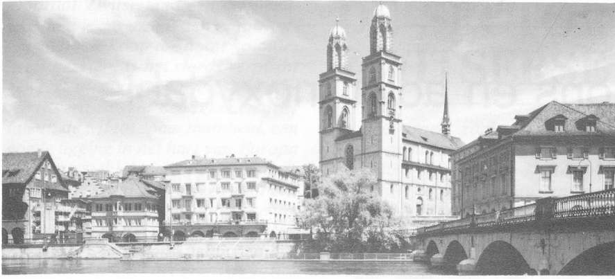
Zürich ne manque pas de romantisme...