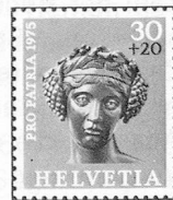
Kopf einer Bacchusstatuette