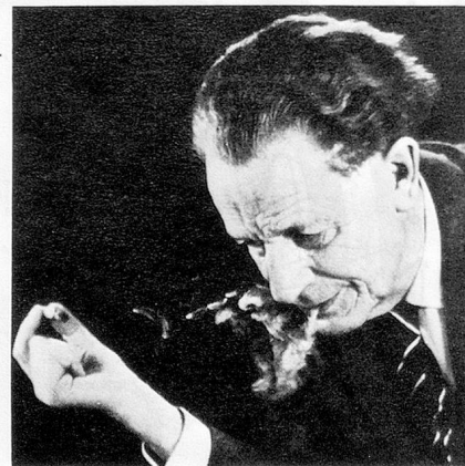
Frank Martin †

Volant au secours du franc suisse, le Conseil fédéral décide que les fonds étrangers déposés en Suisse devront payer une commission de 3% par trimestre, et cela avec effet rétroactif au 31 octobre.