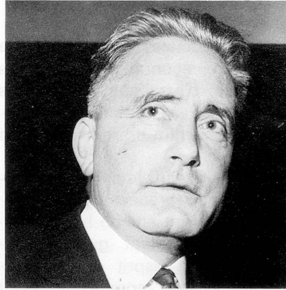
M. le Conseiller fédéral G.-A. Chevallaz.

«assurance séjour» pour la durée d'une villégiature ou d'un stage. Les renseignements à ce sujet peuvent être obtenus directement auprès des caisses-maladies suisses.