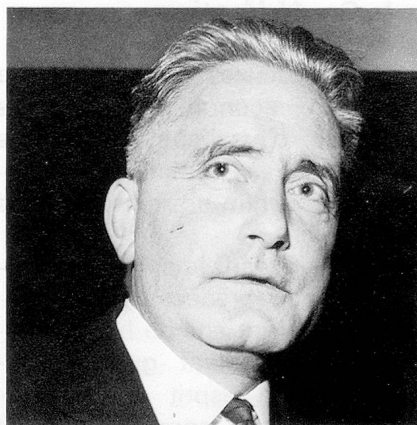
M. le Conseiller fédéral G.-A. Chevallaz.

«assurance séjour» pour la durée d'une villégiature ou d'un stage. Les renseignements à ce sujet peuvent être obtenus directement auprès des caisses-maladies suisses.