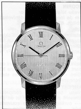
GENEVE. Modèle plat en or ou jaune 18 ct. Cadres divers.