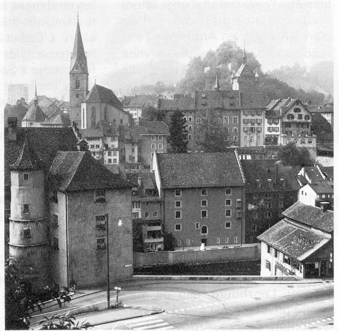
Cité médiévale de Baden au bord de la Limmat

(puisqu'ils traversent la Suisse respectivement de l'est à l'ouest et du sud au nord), ils marquent leur empreinte dans le cœur des Argoviens.