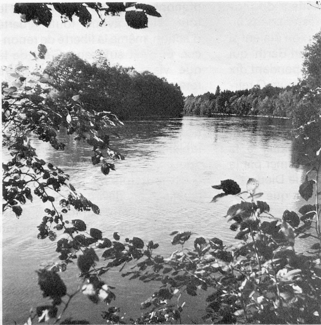
La «Reuss» près de Unterlunkofen