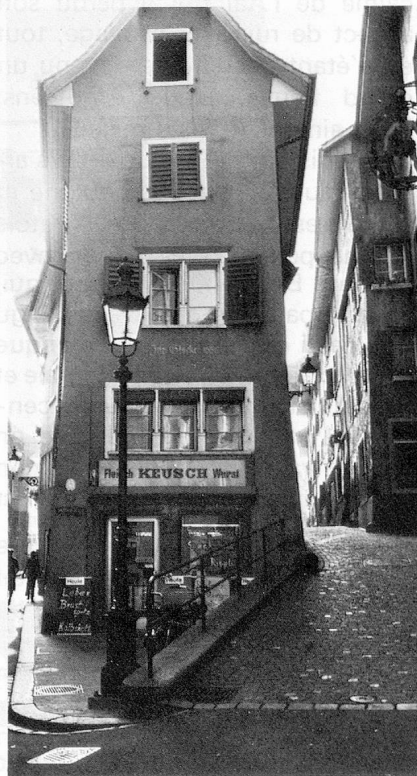
Dans le vieux quartier de Baden (ONST Zurich)

prenons volontiers la partie pour le tout. Nous avons toute liberté d'action, même la liberté de renoncer. Et c'est suffisant. C'est de là que vient peut-être aussi notre retenue, la mélancolie en toile de fond de notre caractère, qui s'exprime dans chaque acte de création, que ce soit un poème, un tableau ou un morceau de musique.