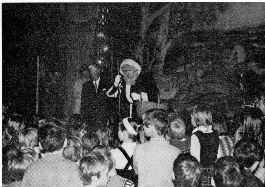
Un reflet de la fête de Noël 1973 à l'Atlanta.

Ce fut une excellente soirée, d'autant plus appréciée que la Direction du Théâtre National nous a consenti, une fois de plus, des conditions très avantageuses.