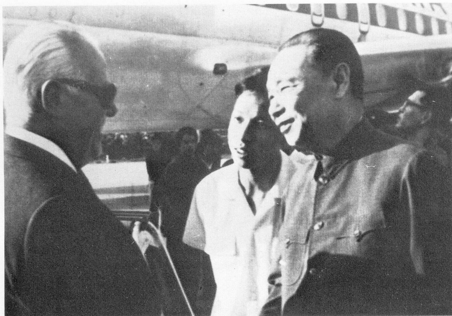
Le Conseiller fédéral Graber accueilli à Pékin par son homologue chinois Tschi Peng Fei.