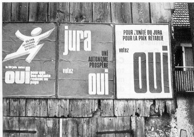
Parmi les nombreuses affiches ...