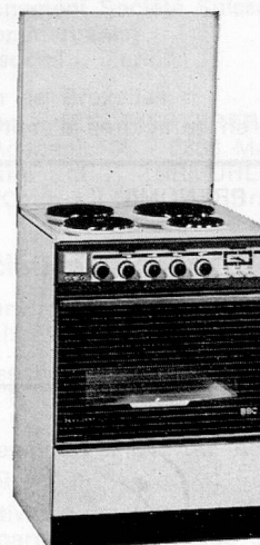
PRÄSIDENT EH 6045

Demandez encore aujourd'hui tous renseignements à : s.a. BROWN BOVERI n.v. Dépt. Electro-Ménager