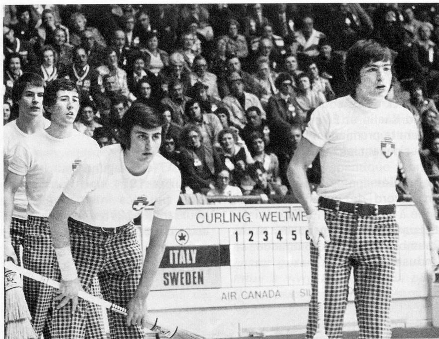
L'équipe du Curling Club Dübendorf gagne la médaille de bronze

La Suisse obtient la médaille de bronze des championnats du monde