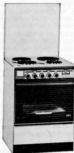
PRÉSIDENT EH 6045

Demandez encore aujourd'hui tous renseignements à :