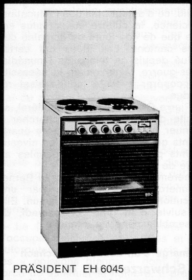
PRÉSIDENT EH 6045

Demandez encore aujourd'hui tous renseignements à :