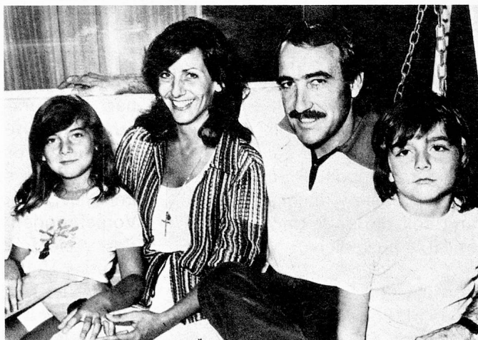
...im Kreise seiner Familie