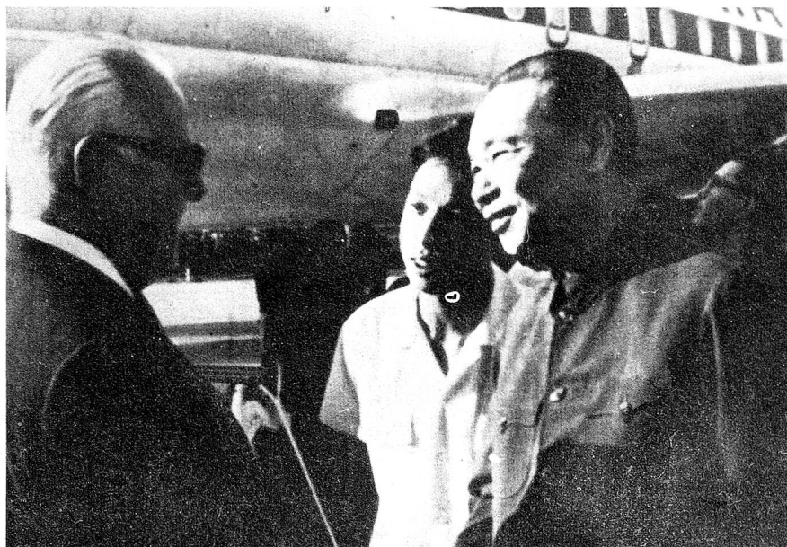
El Consejero federal Graber recibido en Pekín por su colega chino Tschi Peng Fei.