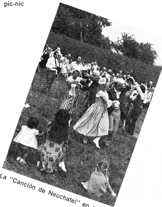
La "Canción de Neuchatel" en acción