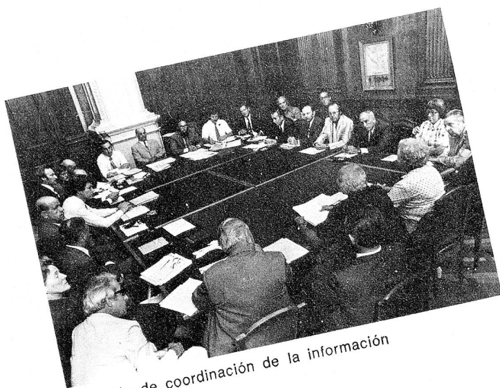
Comisión de coordinación de la información