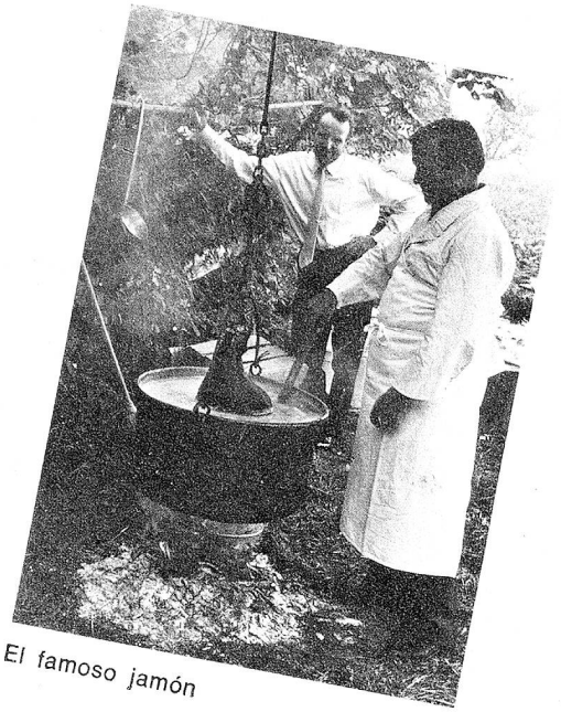
El famoso jamón