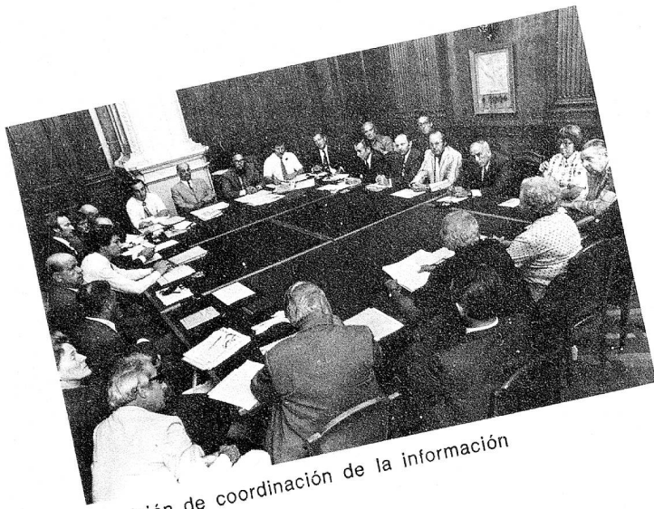
Comisión de coordinación de la información