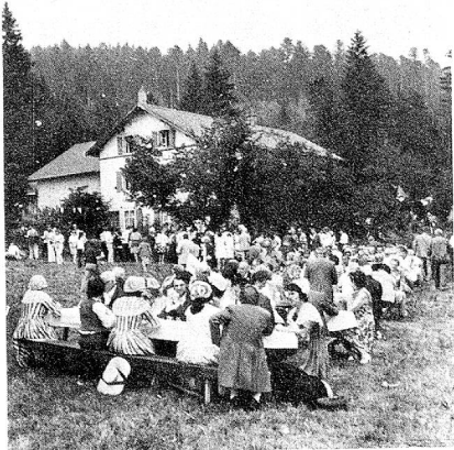
Durante el pic-nic