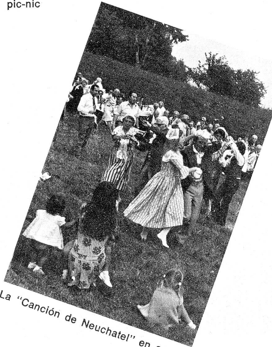
La "Canción de Neuchatel" en acción