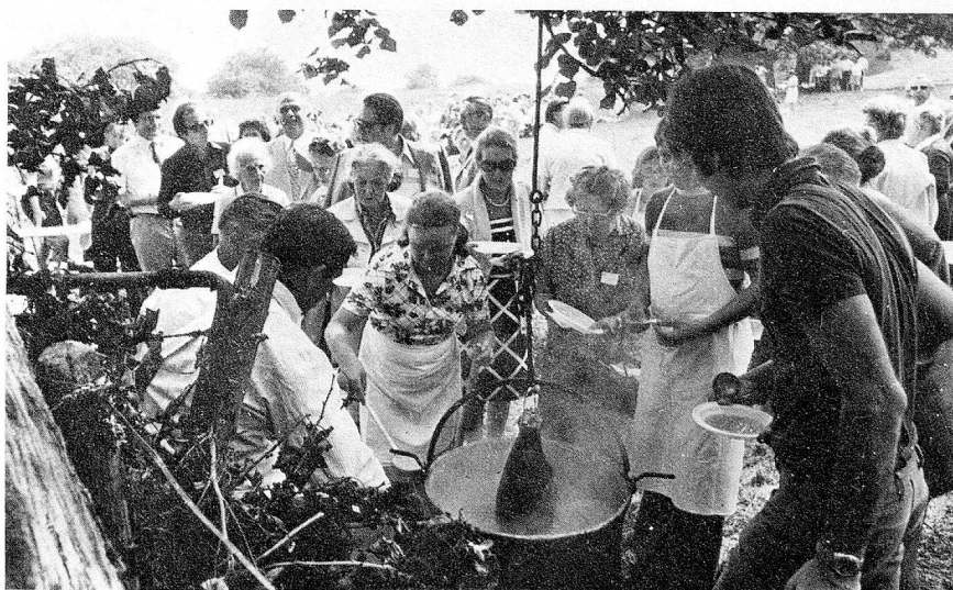
Todos a la "sopa de arvejas"