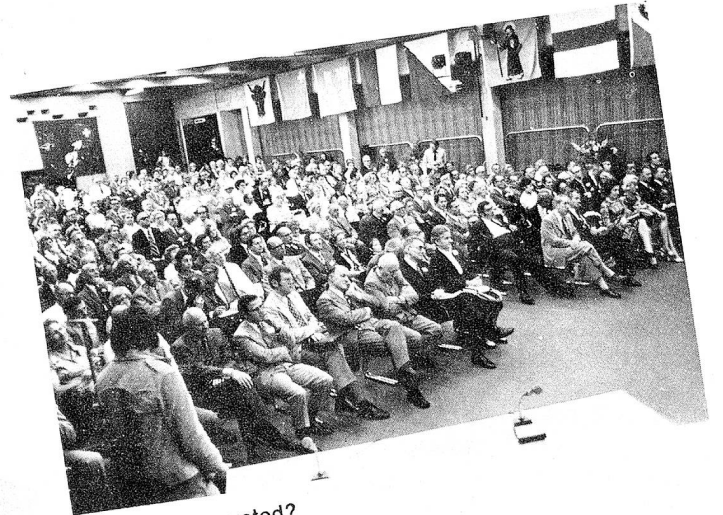
¿Se reconoce usted?