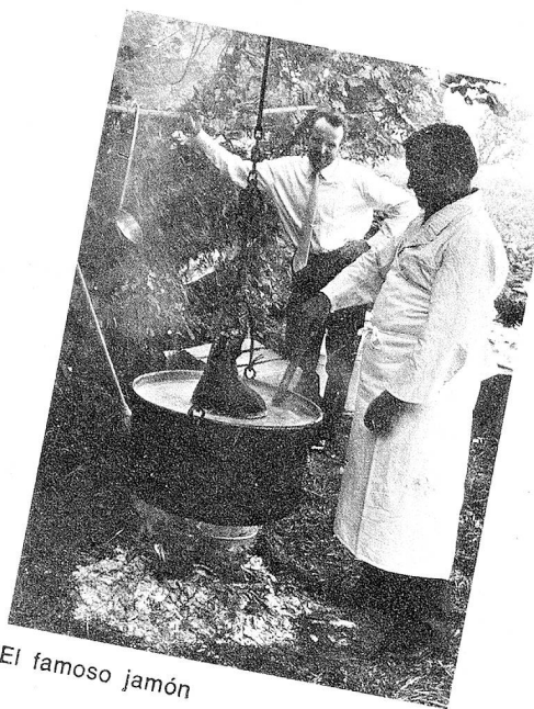
El famoso jamón