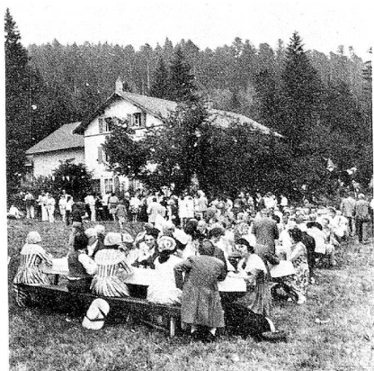
Durante el pic-nic