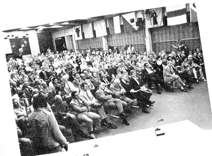
¿Se reconoce usted?