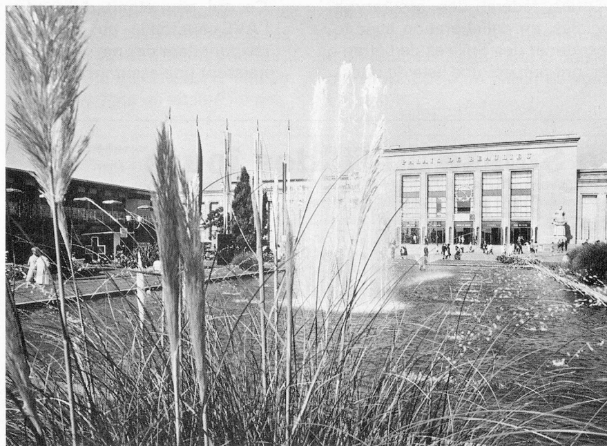
Les jardins du Comptoir suisse de Lausanne (photo Alrège SA, Pully).

En football, dans le cadre des préliminaires pour la coupe du monde