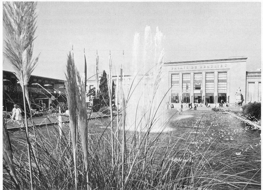
Les jardins du Comptoir suisse de Lausanne.

En football, dans le cadre des préliminaires pour la coupe du monde