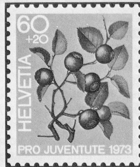
Heidelbeere Myrtille Mirtillo