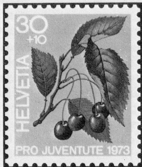
Süsskirsche Merise Ciliegia