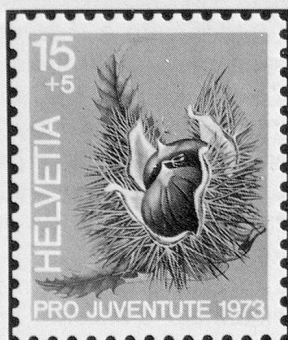
Edelkastanie Châtaigne Castagna

Früchte des Waldes Fruits de la forêt Frutti del bosco