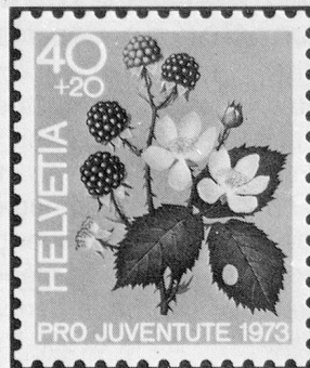
Brombeere Mûre sauvage Mora