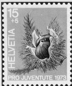
Edelkastanie Châtaigne Castagna

Früchte des Waldes Fruits de la forêt Frutti del bosco