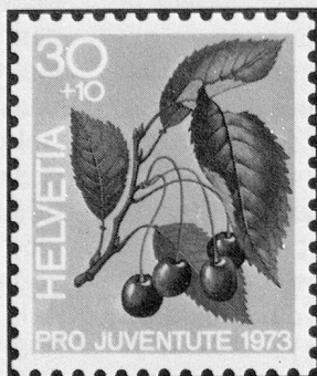
Süsskirsche Merise Ciliegia