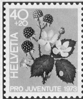
Brombeere Mûre sauvage Mora