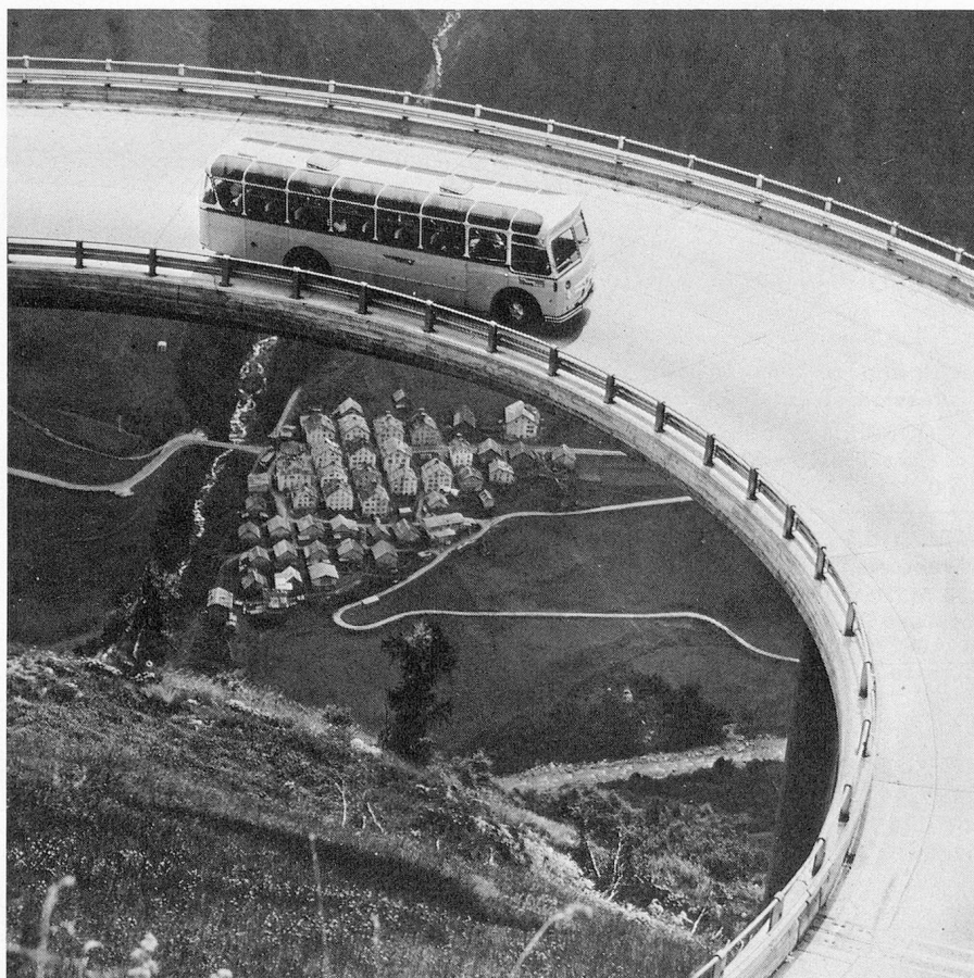
Fontana dans le val Bedretto sur la route du St-Gothard.