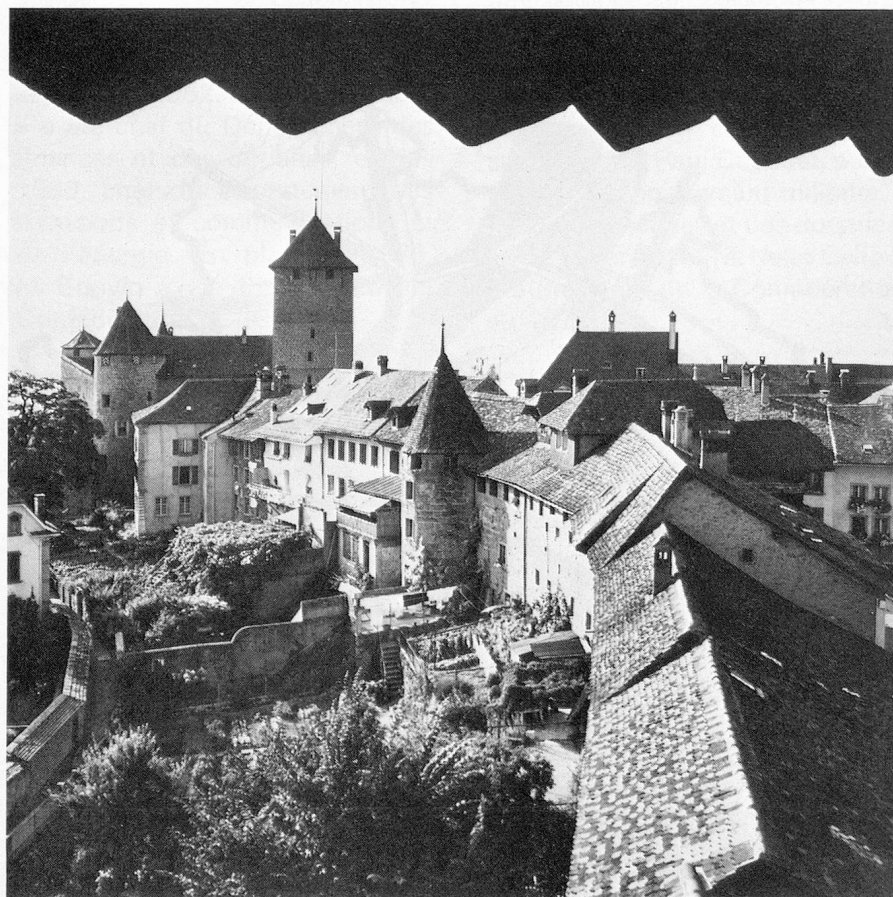
Morat et son centre moyenâgeux.

C'est contre cette administration directe que les Suisses primitifs se sont révoltés. Tout porte à croire que la conjuration du mois d'août 1291 n'était en réalité que l'acte final de tout un réseau d'accords et traités plus techniques, préalablement conclus entre les parties «conjurées». En fait, les habitants des vallées étaient loin d'être des paysans ignorants reclus au fond de leurs montagnes. Certains d'entre eux étaient des commerçants cotés sur les marchés extérieurs, à Francfort, Genève, Lyon, Milan ... On sait que l'un d'eux, Attinghausen, avait conclu un accord commercial avec la ville de Côme en 1270 comportant déjà une sorte de clause de la nation la plus favorisée ... Ces ancêtres de la Suisse se sont rendus parfaitement compte de l'importance qu'allait prendre dans leur propre économie et celle de l'Europe la route carrossable du Saint-Gothard. Les puissances de l'époque, en premier lieu la maison de Habsbourg, en prirent conscience également. D'où la