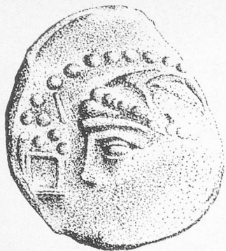
Monnaie helvète. Cette pièce de monnaie helvète provient des fouilles de Bibracte. Ses lignes ne laissent guère de doute quant à l'influence hellénique venue par la route de l'étain jusqu'en Helvétie. (Pièce exposée au Musée Rolin d'Autun – Dessin G. K.-Sp)

pour M. Joffroy, permet d'affirmer que la route de l'étain franchissait le col du Grand-Saint-Bernard, s'engageait à travers le Plateau suisse en direction de Berne, franchissait le Jura et rejoignait à Vix, près de l'actuelle ville de Châtillon-sur-Seine, la voie d'eau jusqu'au Havre qui, par la Manche, menait en Cornouailles. La deuxième branche passait par le Tessin, les cols grisons et atteignait le cours supérieur du Rhin qu'elle empruntait jusqu'au lac de Constance pour rejoindre ensuite les rives du Danube.