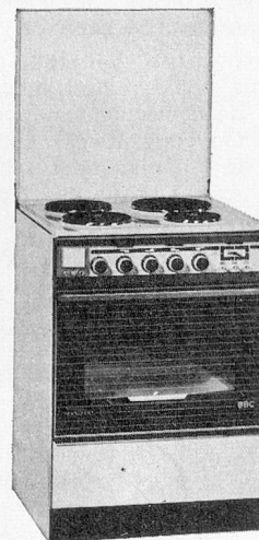
PRÉSIDENT EH 6045