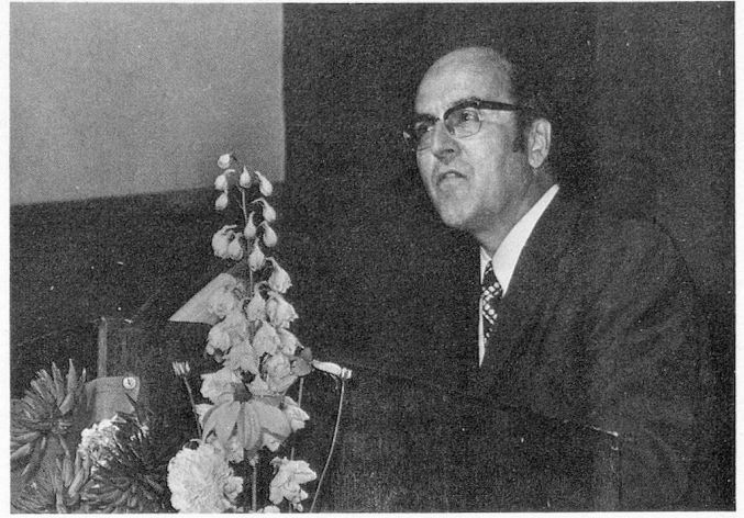
M le Conseiller fédéral Kurt Furgler.