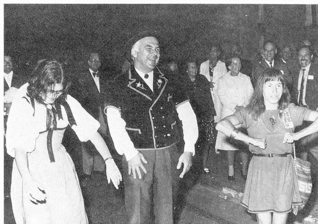
Pour bien terminer une journée, faites comme nous: un picoulet.