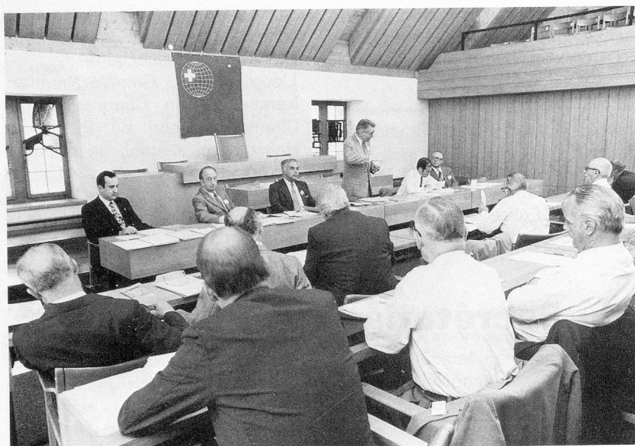
Séance de la Commission des Suisses de l'étranger.