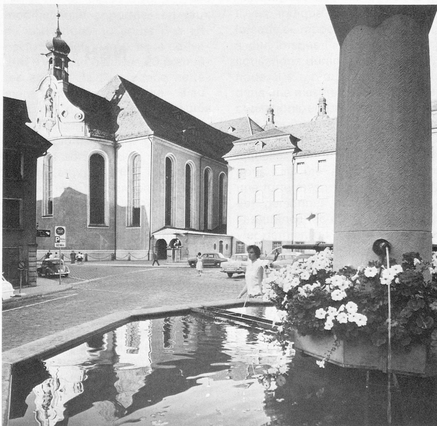
St-Gall, place Gallus

Le Secrétariat des Suisses de l'étranger, Alpenstrasse 26, CH-3006 Berne se tient à votre disposition pour tous les renseignements