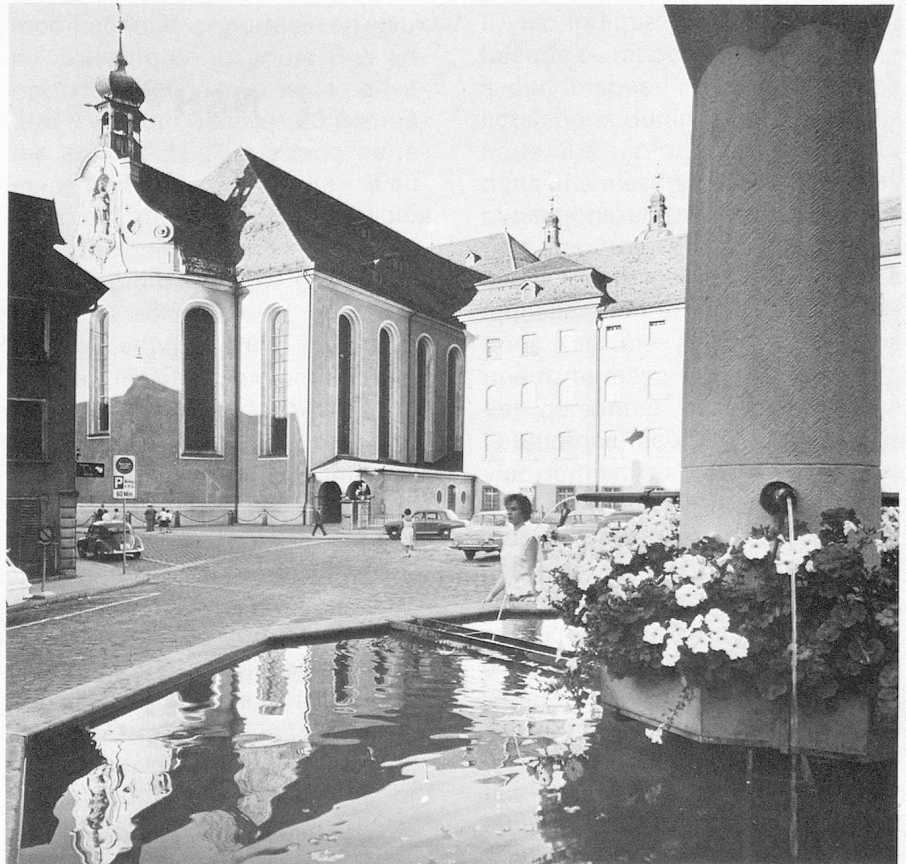
St-Gall, place Gallus

Le Secrétariat des Suisses de l'étranger, Alpenstrasse 26, CH-3006 Berne se tient à votre disposition pour tous les renseignements