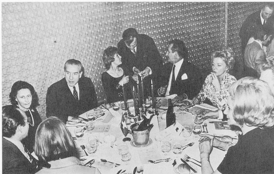
▲ La table de notre Ambassadeur