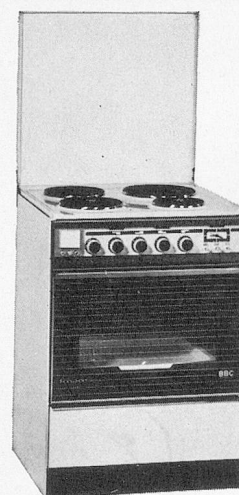
PRÉSIDENT EH 6045