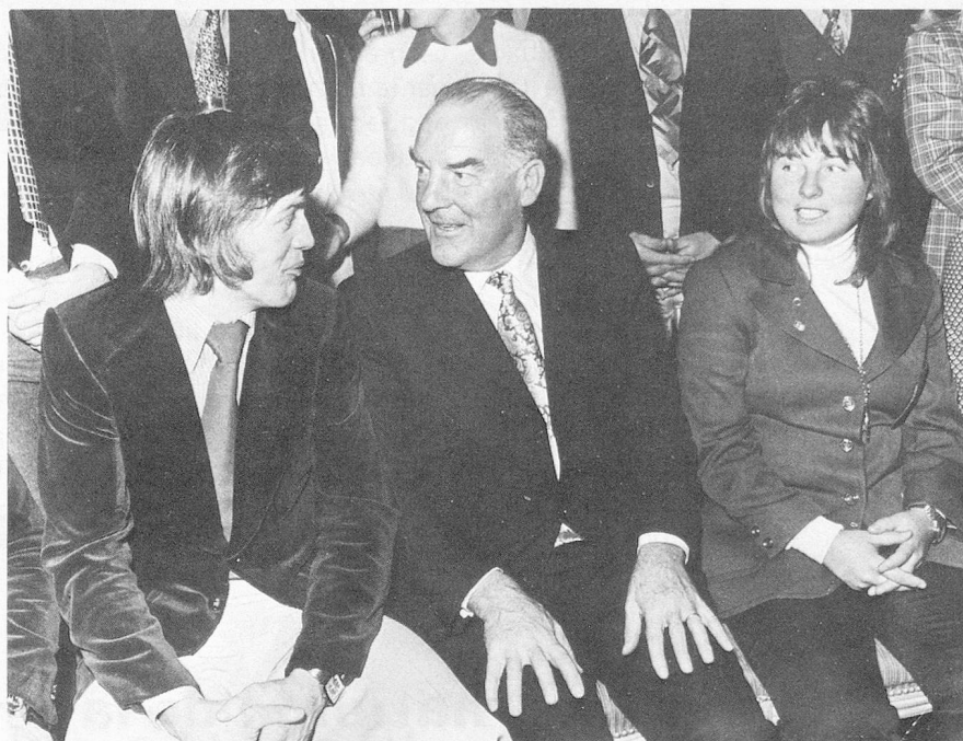
Le conseiller fédéral M. Gnägi a reçu au début décembre nos héros sportifs. On le reconnaît entouré de M.-T. Nadig et de B. Russi.

L'accord de libre-échange avec la CEE est accepté par tous les can-