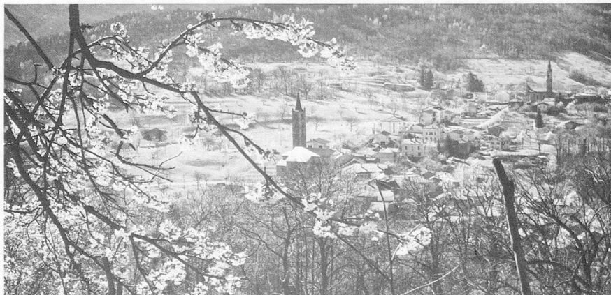
Printemps sur les villages de Sala et Vaglio.

Le but de ces remarques était de dégager certaines constantes et les limites d'une situation culturelle; elles ont, par conséquent, quelques lacunes sur le plan de l'information, des lacunes d'ailleurs inévitables lorsqu'on essaie de rendre compte d'une matière vivante qui est encore en formation.