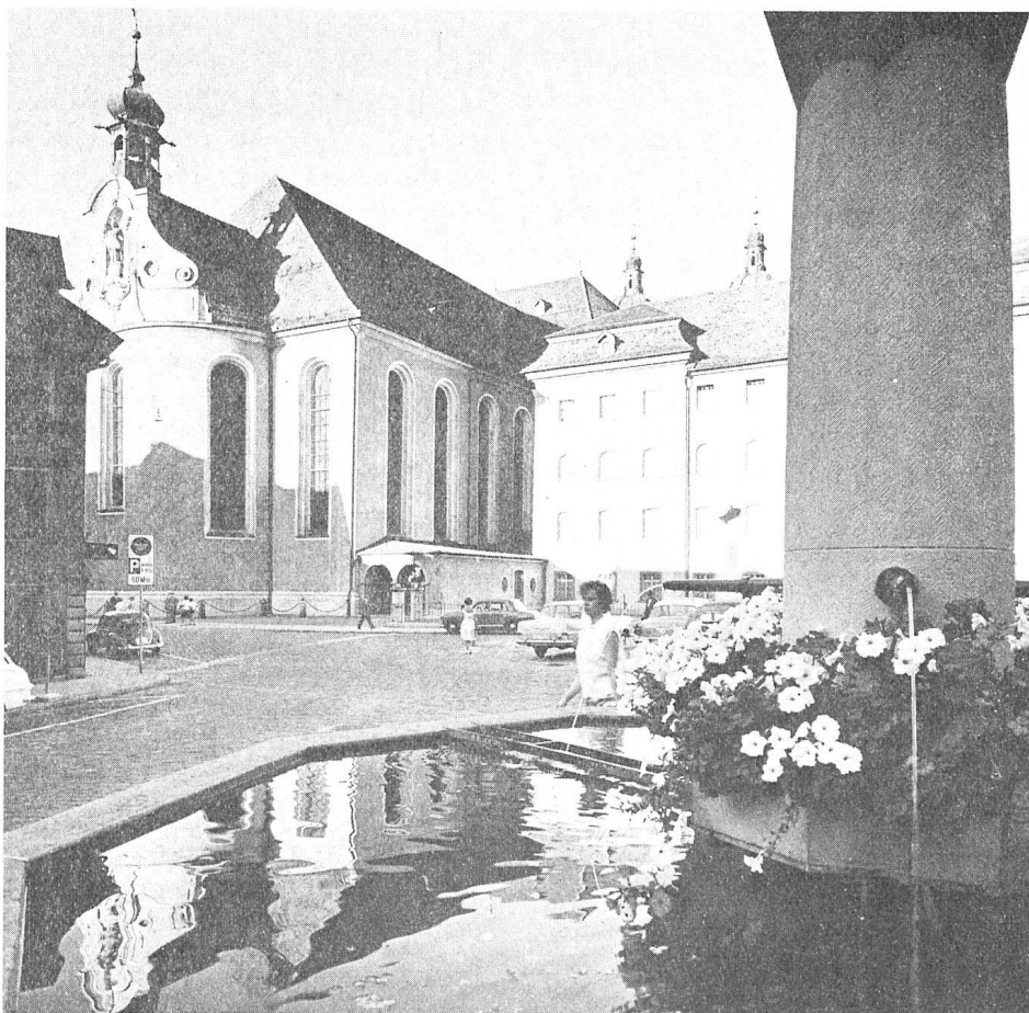
St. Gallen, Gallusplatz

Detaillierte Auskünfte betreffend Anmeldung, Hotelunterkunft und Tagungsprogramm können anhand des untenstehenden Talons