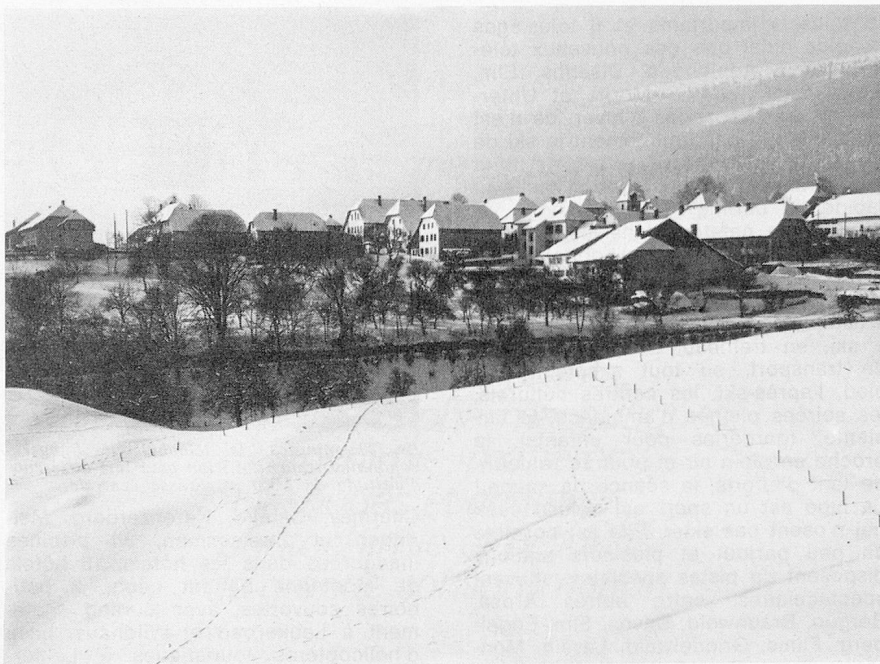
Vue sur Nods (Jura bernois)

Dès le 1 er janvier une limitation généralisée de la vitesse, fixée à 100 km, sera introduite sur toutes les routes de Suisse, sauf indications locales et sur les autoroutes . Cette mesure prévue pour une durée de trois ans permettra des études statistiques appro-