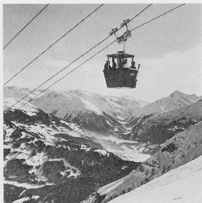
En 20 minutes, le téléphérique Lungern-Schönbühl franchit 4,3 km pour une différence d'altitude de 1.300 m, Suisse centrale.

Après avoir aménagé à grand frais les installations de ski de descente, les stations font actuellement un effort général en faveur du ski de randonnée : 75 d'entre-elles annoncent 1.150 km de pistes entretenues tous les jours et une quinzaine d'autres de promenades balisées. Ces pistes sont souvent marquées de 3 L (LLL) ce qui signifie en allemand que les skieurs de fond vivent plus longtemps — à bon entendeur, salut ! Le ski de randonnée permet également à certains villages charmants mais sans équipement d'ouvrir leur rusticité aux amoureux de pittoresque et de tranquillité, alors qu'ailleurs, le confort ne cesse de s'accroître : 5 nouvelles piscines de station à