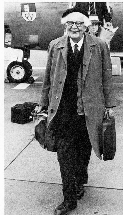
Le psychologue suisse Jean Piaget.

naie. Stabilisation du marché de la construction: 724 819 oui, 154 805 non. Sauvegarde de la monnaie: 808 683 oui, 113 314 non. Le pourcentage des votants, 25,8%, a été un des plus faibles jamais enregistrés.