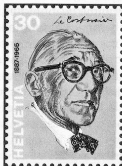
Le Corbusier Ch. Ed. Jeanneret 1887-1965 Architecte et peintre