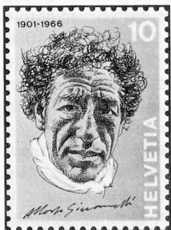
Alberto Giacometti 1901-1966 Peintre et sculpteur