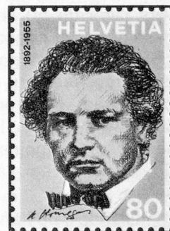
Arthur Honegger 1892-1955 Compositeur