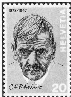
Charles Ferdinand Ramuz 1878-1947 Ecrivain