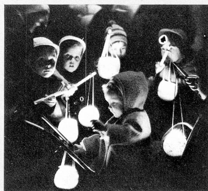
Un cortège lumineux d'ancienne tradition

Quand, à la fin d'octobre et au commencement de novembre, dans les vallées de la Glatt et de la Thur, dans les vignobles et le bas-pays zuricois, jusqu'au delà de la vallée de la Limat et au bord du lac de Zurich, on récolte les raves, à l'époque des derniers beaux jours qui précèdent la Saint-Martin, c'est le moment pour la jeunesse de célébrer une charmante coutume : celle des raves taillées avec soin, munies à l'intérieur de bougies et transformées en lanterne. Elles sont alors portées, au son d'un harmonica ou de la musique locale, en un cortège qui serpente de village en village, par des enfants qui manifestent leur joie en chantant.