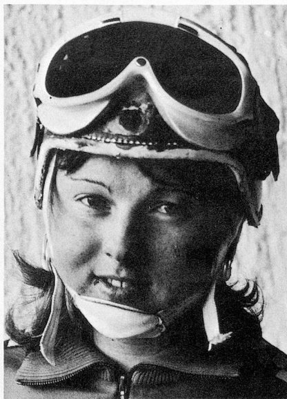
◀ Marie-Thérèse Nadig, Flums, 1954

Puis contre toute attente, Marie-Thérèse Nadig remporta le slalom géant devant l'Autrichienne A.-M. Proell, complètement déçue. Enfin, notre quatrième médaille d'or,