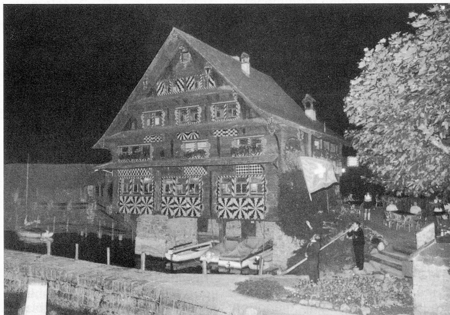
▲ Le samedi soir, à chaque halte du bateau, des groupes folkloriques accueillirent joyeusement les participants

La dernière journée du Congrès fut consacrée à une excursion qui, après une halte au Rütli, où eut lieu un culte oecuménique, amena les participants au Bürgenstock.