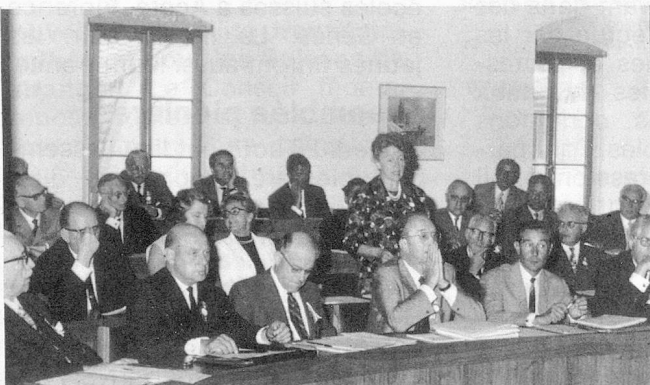
La séance de la Commission des Suisses de l'étranger.