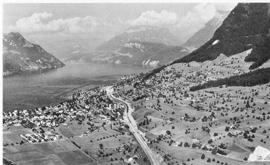
▼ La Nationale2 actuellement en construction au bord du lac des Quatre-Cantons.