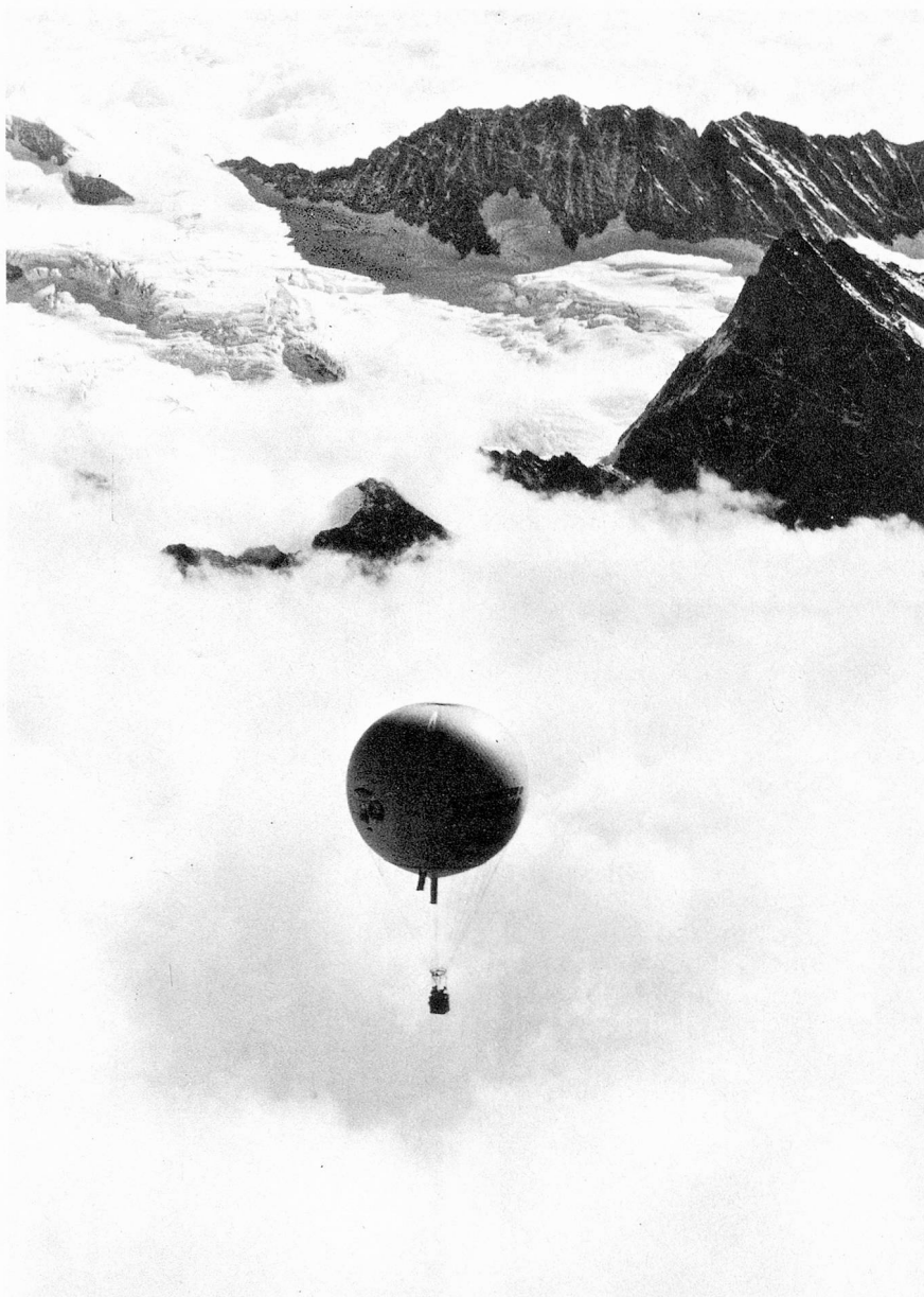
Ballon voguant au-dessus de la mer de brouillard