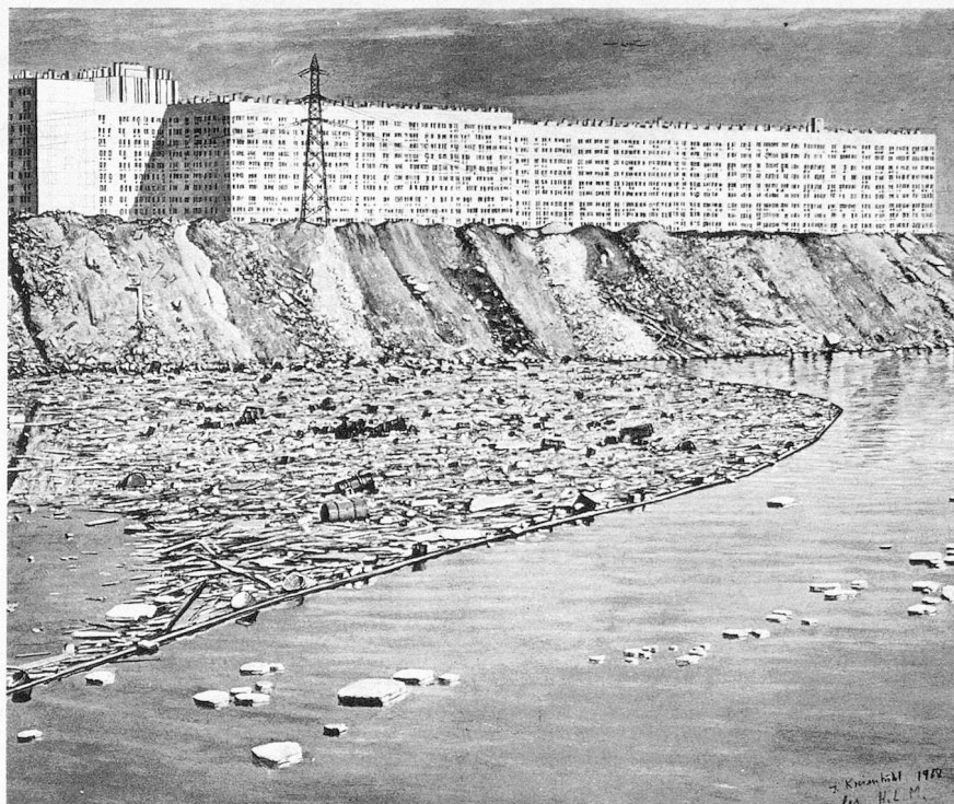
Jürg Kreienbühl: «les H.L.M.»

Avec l'exposition d'Aarau les artistes suisses présentaient pour la première fois leurs œuvres en groupe en Suisse – si