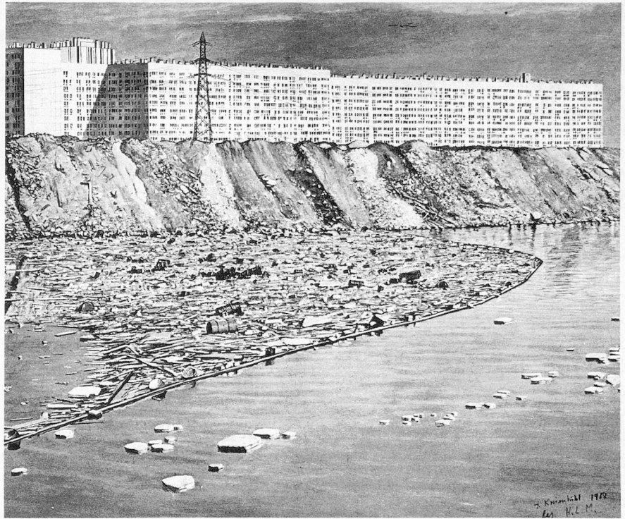
Jürg Kreienbühl: «les H.L.M.»

Avec l'exposition d'Aarau les artistes suisses présentaient pour la première fois leurs œuvres en groupe en Suisse – si