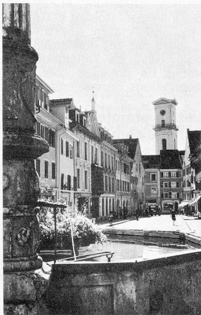
La fontaine de Delémont

Mais, au point de vue politique, les citoyens se plaignaient de n'avoir aucun droit: le Grand Conseil ne comptait que peu de représentants du peuple et les charges publiques étaient presque toutes attribuées aux membres de l'aristocratie bernoise.