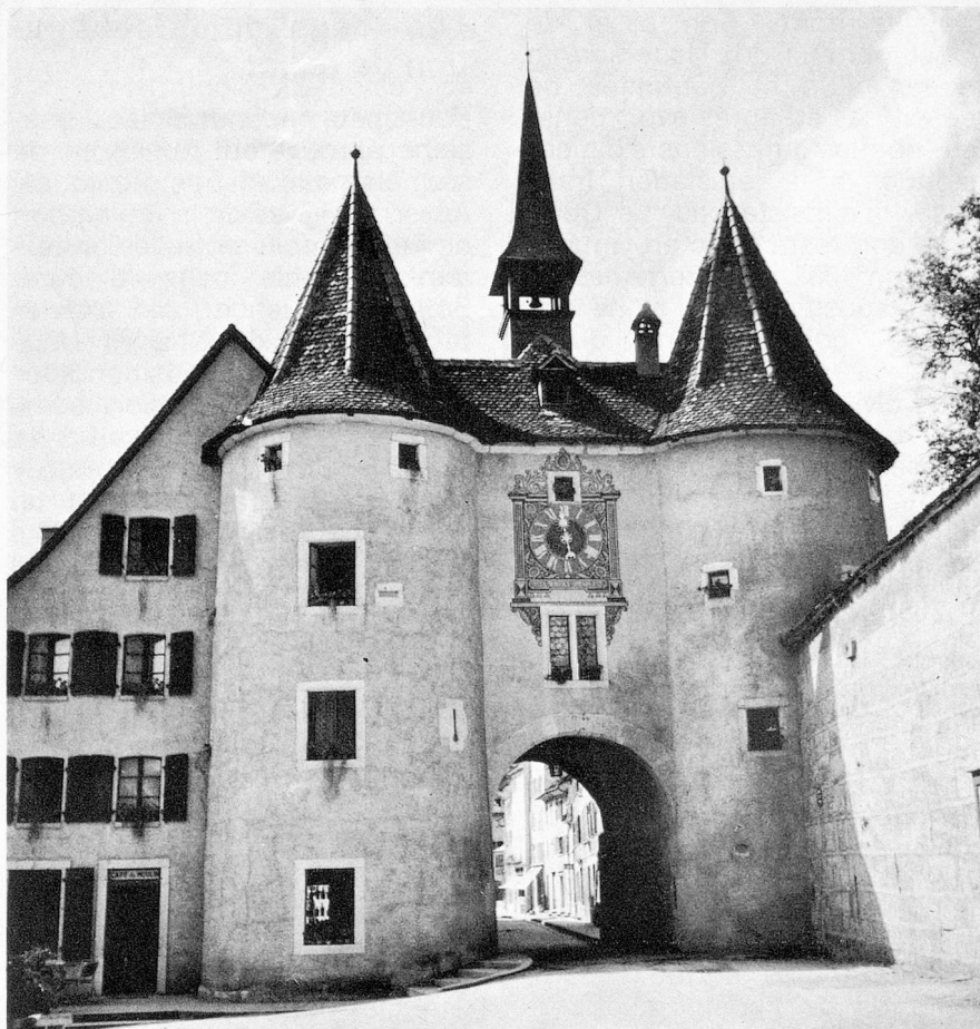
Porrentruy, la Porte de France

Laissant à Porrentruy un conseil de régence, le prince-évêque s'enfuit à Bienne dans la nuit du 28 au 29 avril 1792. L'Ajoie, qui désirait la Révolution, devait, dans la suite, la subir. La République rauracienne, installée le 27 novembre, fut renversée le 13 mars 1793 à la suite d'une des plus sinistres farces des Français, privant 77 députés du Jura sur 115, de leur droit de vote. Puis, la Convention rendait un décret acceptant «le vœu librement émis par le peuple souverain de Porrentruy». Succèdent à la République rauracienne, le département du Mont-Terrible 1793-1800, puis celui du Haut-Rhin 1800-1814. Finalement, le 27 janvier 1814, au nom des puissances alliées, le baron d'Andlau-Birseck prend possession de notre pays en attendant que le sort en fût fixé.