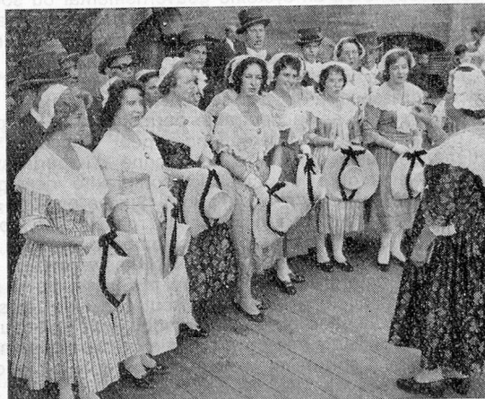
Un avant-goût de la Chanson Neuchâteloise qui animera notre Fête Nationale le 27 Juillet à Bruxelles.

Quelque part dans ce monde, il est un pays généreuse- ment doté par la nature. Son climat clément et ses terres extrêmement fertiles lui permettent de faire deux moissons par année. Ses plantations fournissent d'abondantes récoltes de coton, de canne à sucre, de bananes, de café, de tabac et même de caoutchouc. Dans les montagnes de l'intérieur, paissent d'immenses troupeaux de bétail et de moutons. Les eaux qui baignent ses côtes sont très pois- sonneuses. D'importants gisements de minéraux, de pierres précieuses et de charbon ont été découverts et sont en partie exploités. On y trouve également du pétrole.