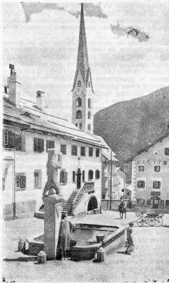
Quelque part dans les Grisons