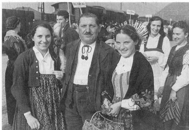
Ricordi del passato