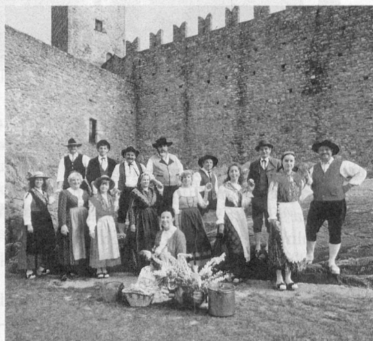
1993: l'attuale Gruppo danza