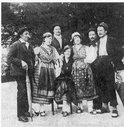
I fondatori del Gruppo Canzoni e Costumi Ticinese di Bellinzona nel 1923:

Con il passare degli anni, il Gruppo si affermò sempre più in patria e all'estero e seppe validamente inserirsi nel filone del vero folclore grazie ai fattori determinanti che costituiscono la caratteristica della Società e possono essere così riassunti: i costumi che, fogge fedelmente autentiche e risalenti al 17°, 18° e 19° secolo, rappresentano non solo la regione bellinzonese, ma tutto il Ticino; il coro che, con le sue canzoni a quattro voci, predilige e valorizza gli autori nostrani; le danze che, accompagnate da