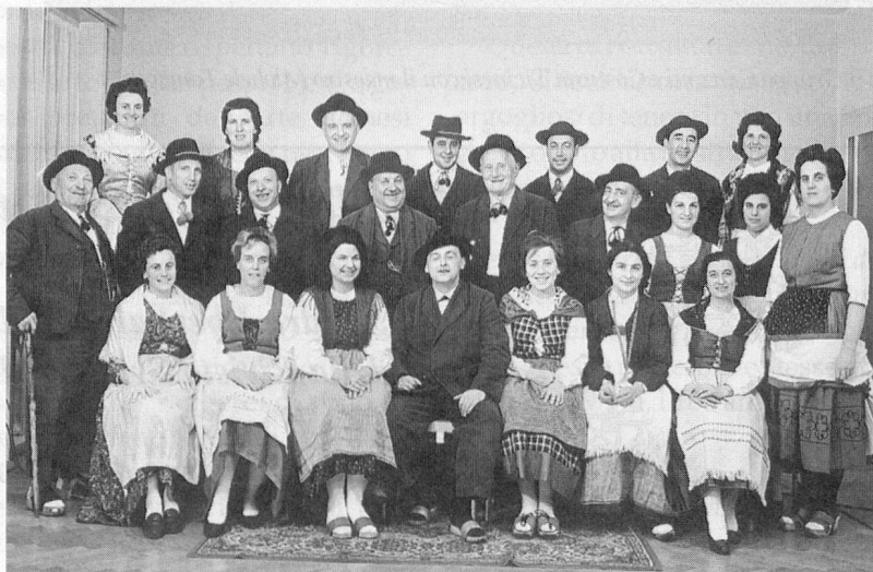
Gli anni 60?

Ottenibile al prezzo di fr.18.- presso Domenica Petralli Viale Stazione 7 – 6512 Giubiasco.