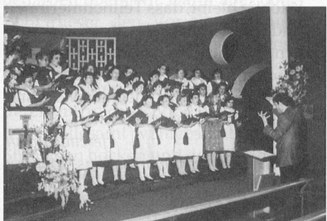
Choeur de dames de Martigny