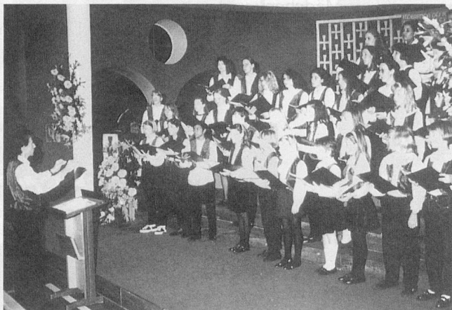
Neue Mädchenkantorei beider Basel

Die jungen Sängerinnen und Sänger genossen denn auch ganz besondere Sympathie und Anerkennung von seiten der Erwachsenenchöre.