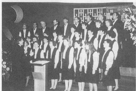
Echo des Follatères, Branson/Fully