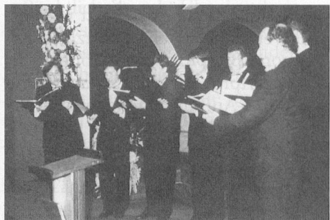
Octuor Vocal, Sion