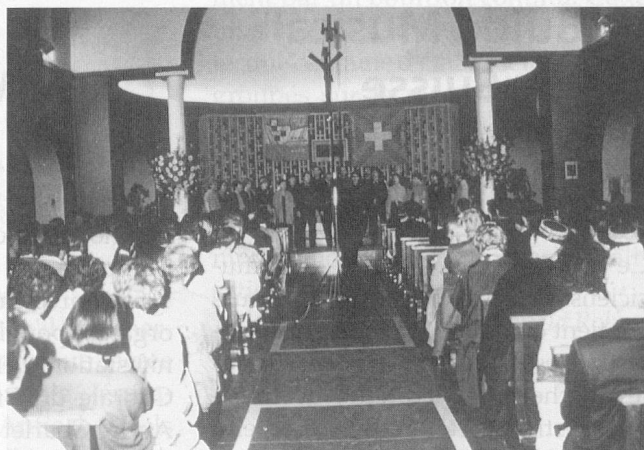
Une vue d'ensemble de la salle du concours: l'Eglise de Montana