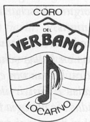
Il Coro del Verbano, Locarno

In questa rivista si è già parlato del Coro del Verbano sul numero di giugno, in occasione dell'Assemblea dei Delegati dell'Unione Svizzera delle Corali a Locarno. Fu infatti questo coro a rallegrare la gita all'Isola di Brissago di una trentina di partecipanti, gita che altrimenti sarebbe stata ben triste con la pioggia persistente di quel giorno!