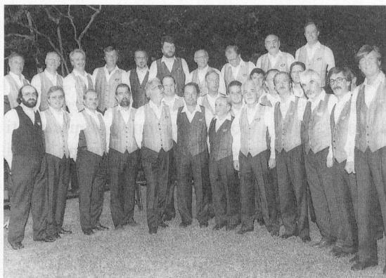
I Cantori delle Cime

«Questo CD è per noi uno dei frutti più belli sotto la direzione del maestro Brazzola.»