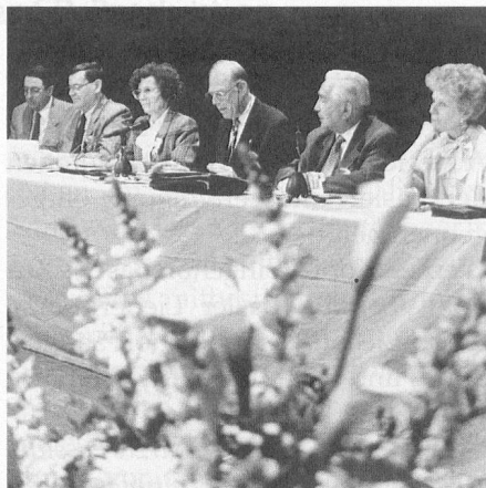
L'ancien Comité directeur