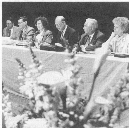
L'ancien Comité directeur