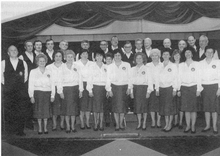
Il «Coro la Grigia» nel suo 20. mo anniversario