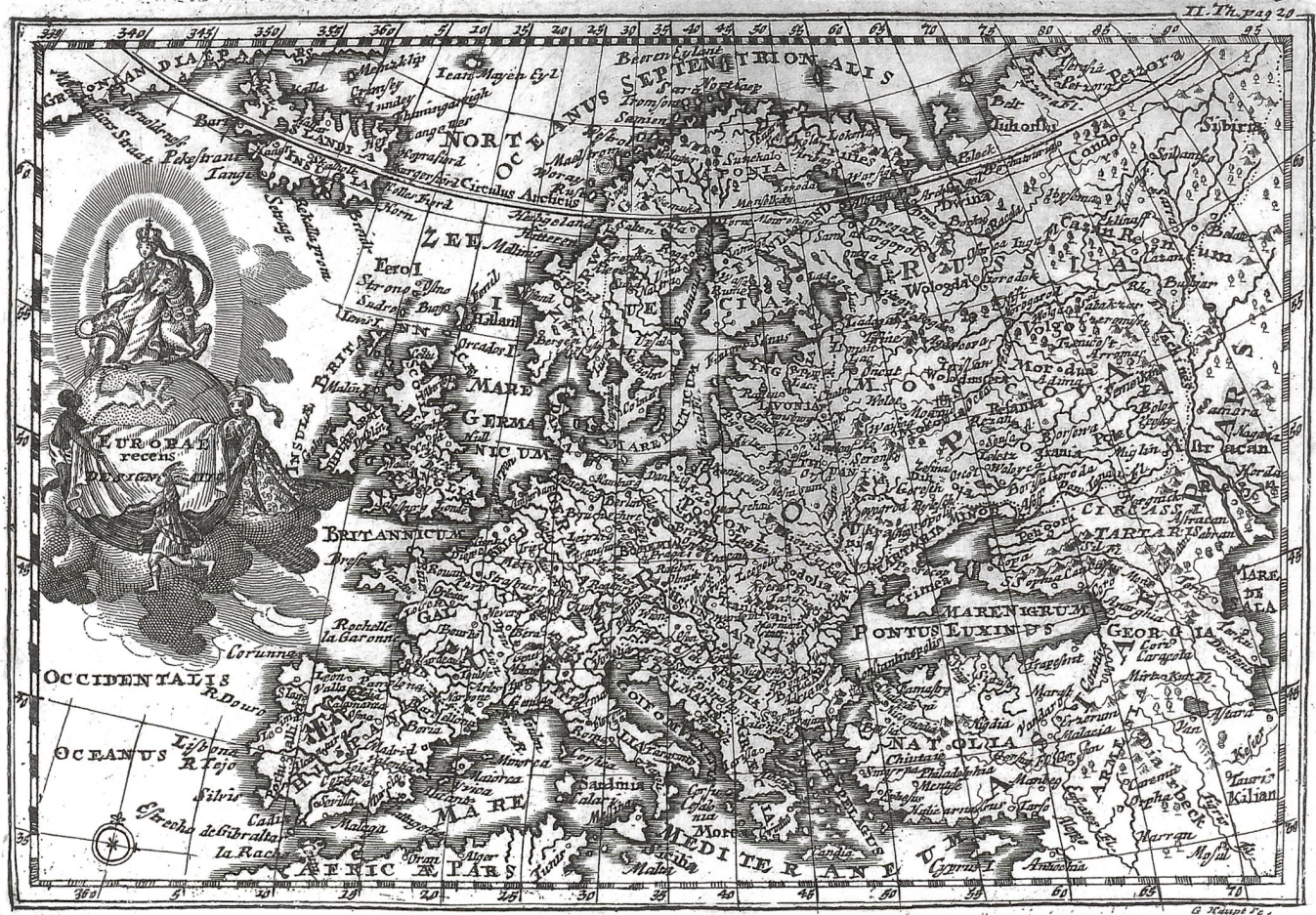
Abb. 2: Karte von Europa (17 x 11 cm), Auftragsstich von G. J. Haupt für ein bildungsbürgerliches Lehrbuch von Carl Ludwig de Launay, Augsburg 1738 (Sammlung Anton Lotter, Augsburg).