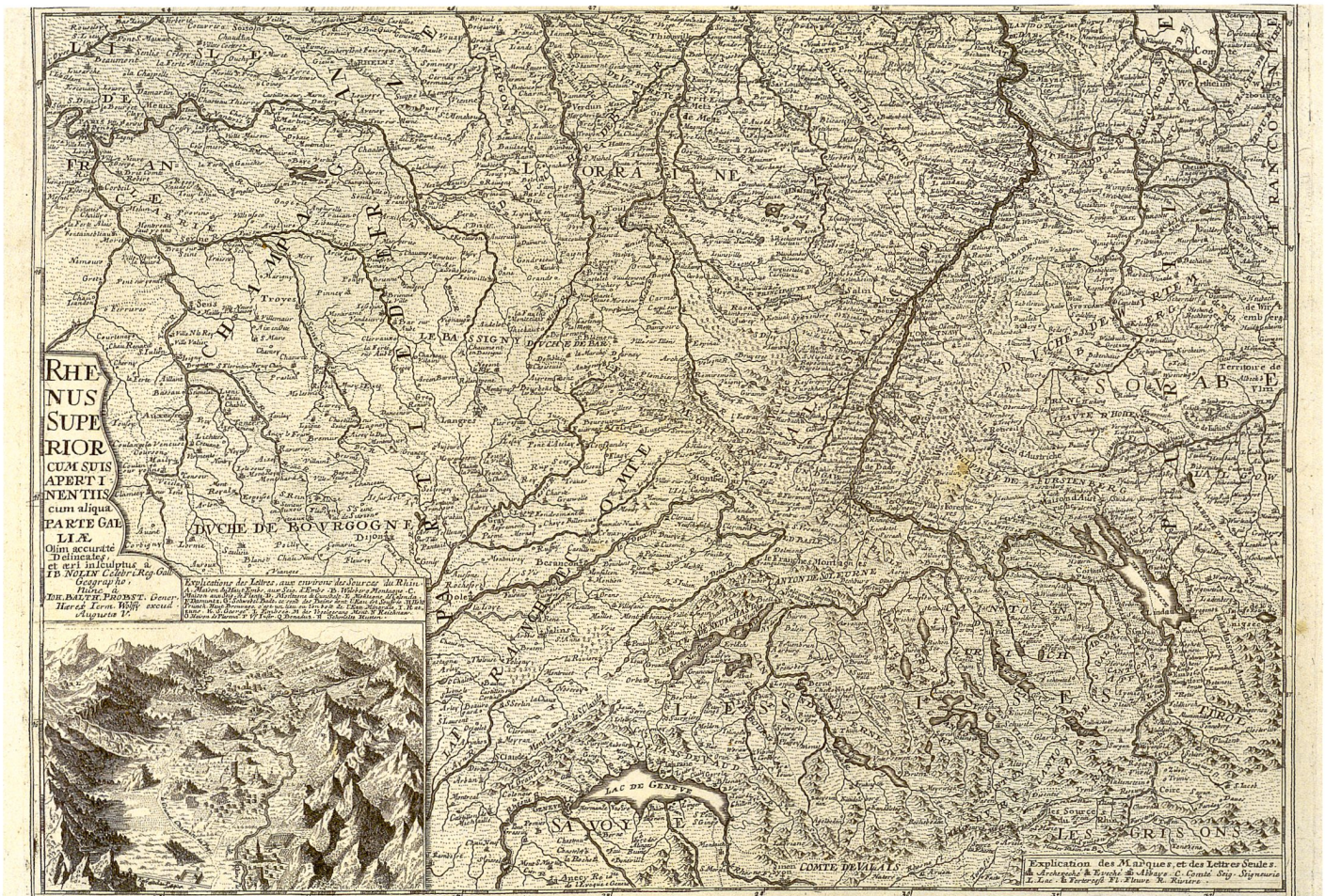
Abb.9: Karte des Oberrheins (56 x 48 cm) von Johann Balthasar Probst, der die Kupferplatte dieser Karte noch in den 1740er Jahren aus dem Vorbesitz von G. J. Haupt übernommen hatte. Abbildung ohne obere und untere Randleiste (Staats- und Stadtbibliothek Augsburg, Sign. 18PA-14).