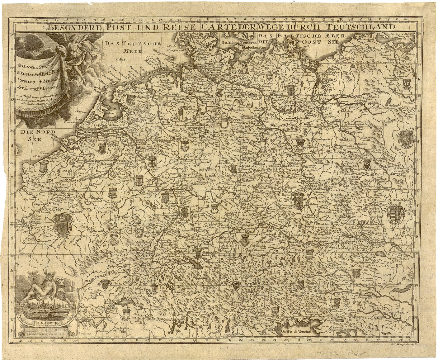
Abb.3: Das Reisehandbuch Die vornehmsten Europäischen Reisen enthielt ab der 10. Auflage, Hamburg 1749, Karten von G. J. Haupt, darunter eine Post- und Reisekarte von Deutschland. Im Gegensatz zu ihren absolutistischen Nachbarstaaten, die durch Krone und Herrscherwappen symbolisiert sind, ist die Schweiz auf dieser Reisekarte durch einen bürgerlichen Hut und einen Wappenschild mit den acht Kantonen der Alten Eidgenossenschaft repräsentiert. (Staats- und Stadtbibliothek Augsburg, Sign. 18PA-18).

modischen Erscheinungsbild dürfte zudem die mehrfach verwendete, schwer lesbare Frakturschrift mit ihren gebrochenen Buchstaben beigetragen haben. Auch wenn die Karten Haupts einige verbindende Merkmale aufweisen, so sind sie zusammenfassend dennoch von grosser Heterogenität hinsichtlich Format, Gestaltung und Schrift gekennzeichnet. Auch fällt auf, dass manche Karten in der Feinheit des Stiches und in der Ausschmückung sehr ambitioniert, andere dagegen von beinahe schlampiger Ausführung sind. Haupt war also kein Kartenmacher, der ein langfristig ausgerichtetes verlegerisches Konzept verfolgte; vielmehr begnügte er sich damit, den schnellen Informationsbedarf zu befriedigen – er war als Kartenproduzent also nie ein Agierender, sondern immer nur ein Reagierender. Die hinterlassenen Karten erlauben es sicherlich nicht, Haupt einen Meister seines Faches zu nennen, jedoch belegen sie durchaus ein gewisses Bemühen um Eigenständigkeit und Originalität. Gottfried Jacob Haupt schaffte es nie aus dem Schatten der grossen Kartenstecher und -verleger seiner Zeit herauszutreten. Zu Recht steht er daher unter den Kartenmachern des 18. Jahrhunderts in der zweiten oder dritten Reihe. Doch gerade diese noch vielfach im Dunkeln liegenden hinteren Reihen auszu-leuchten, gehört mit zu den aufschlussreichsten und spannendsten Aufgaben der Kartographiegeschichte.