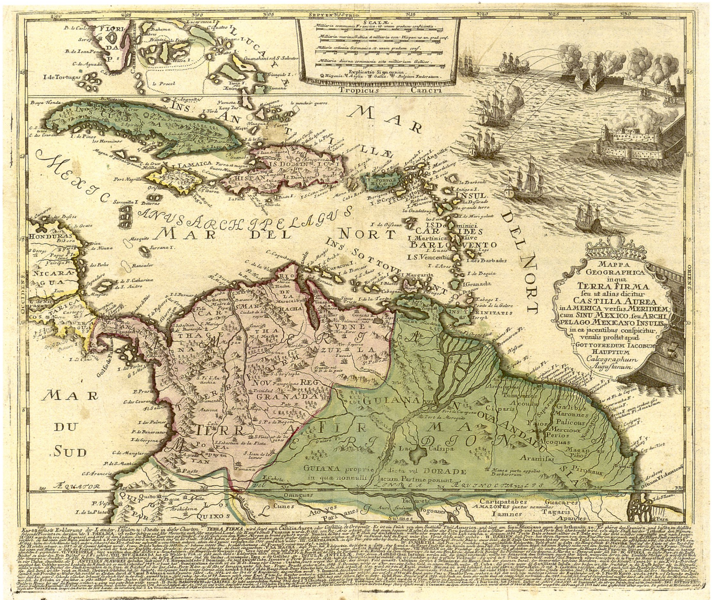
Abb.4: Karte der Karibischen Inseln und der Nordküste Südamerikas (57 x 43 cm) von G. J. Haupt, um 1740 (Staats- und Stadtbibliothek Augsburg, Sign. 18PA-1).

kriegswichtige Stadt am Zusammenfluss von Donau und Save. Genau dieses Ereignis greift Haupt's Plan 44 auf, der zeigt, wie die Festung durch türkische Kanonen heftig beschossen wird. In drei Ecken des Blattes sowie in einer Fussleiste werden ergänzende textliche Informationen (Legenden, geschichtliche Erläuterungen) zum besseren Verständnis der dargestellten Situation gegeben. Als Vorlage hatte Haupt der 1717 bei Johann van der Bruggen in Wien erschienene Belgrad-Grundriss von A. Ribro Cuntats gedient. Allerdings war dieser inhaltlich ziemlich veraltet, was Haupt offenbar erst mit Verspätung bemerkte, da es seinen Plan auch in einer aktualisierten Version herausgab, in der u.a. die mittlerweile errichteten Forts jenseits des Donau- und des Save-Ufers nachgetragen sind. Dieser Stich dürfte nur ein sehr kurzfristiger Verkaufserfolg gewesen sein, da die Stadt bereits wenige Wochen später im Frieden von Belgrad an das Osmanische Reich zurückgegeben werden musste. 45