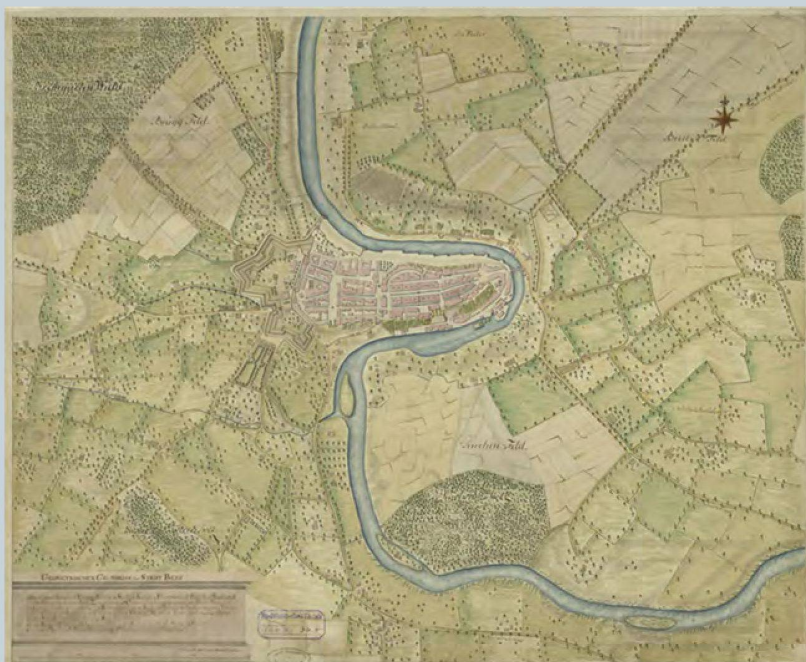
Abb.1 (oben): Graphische Suche in kartenportal.ch Abb.2 (Mitte): Bibliographische Aufnahme in swissbib Abb.3 (unten): Bilddatei der Zentralbibliothek Zürich