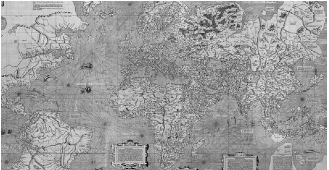
Abb. 2: Ausschnitt aus der von Gerhard Mercator 1569 publizierten Weltkarte. Sie diente als Vorlage für das Kartenbild des Erdglobus.