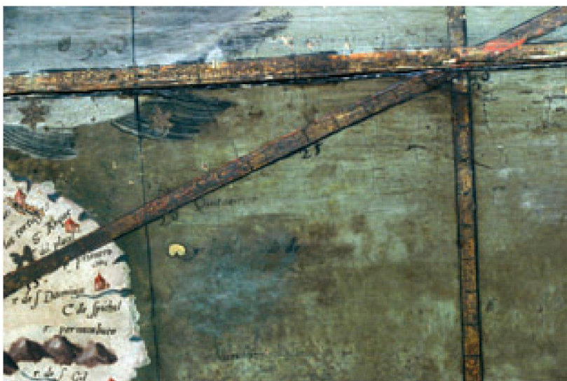
Abb. 4 (oben): Die Skalen bei der Replik des Meridianrings geben an: geographische Breiten, Klimazonen mit Angaben zur Sonnenscheindauer, astronomische Breiten.