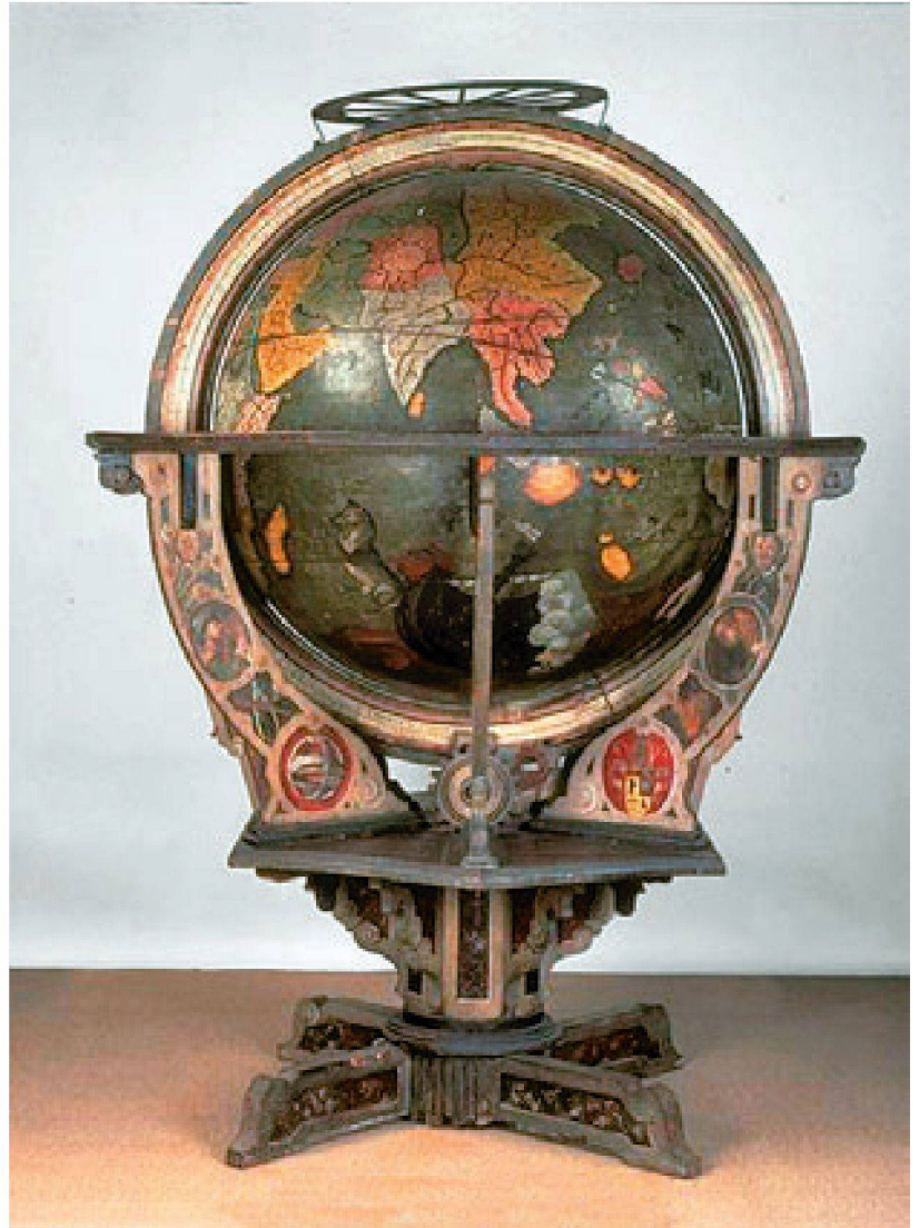
Abb. 1: Der Erd- und Himmelsglobus von St. Gallen. Durchmesser 120 cm (Photo: Schweizerisches Landesmuseum Zürich).

Für zwei Orte auf dem Erdglobus kann nicht nur ihre Distanz ermittelt werden, sondern auch die Himmelsrichtung, in welcher sie zueinander liegen: Dafür rückt man den Ausgangsort in den Zenit, indem der Meri-